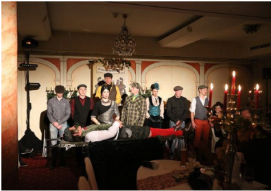
Kunst & Kulinarik